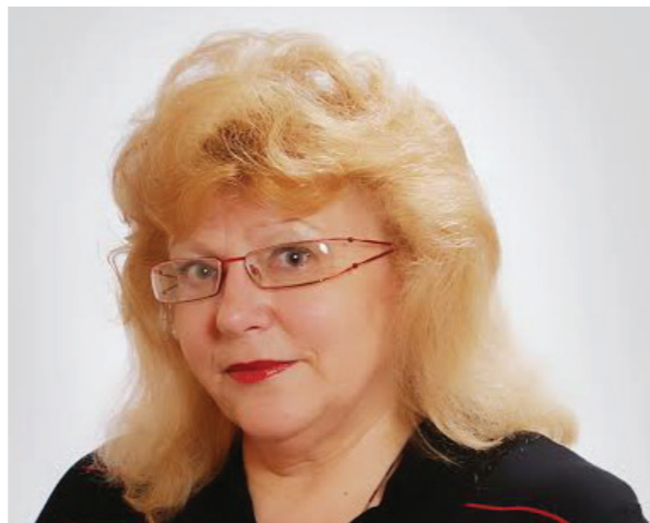
Старшыня БСДП Ірына Вештард

Аддаючы галасы ў падтрымку кандыдатаў ад Беларуская сацыял-дэмакратычнай партыі (Грамады) вы падтрымліваеце не толькі іх праграмы і іх асобы - вы падтрымліваеце каштоўнасці сацыял-дэмакратыі, якімі з'яўляюцца свабода, справядлівасць і салідарнасць!